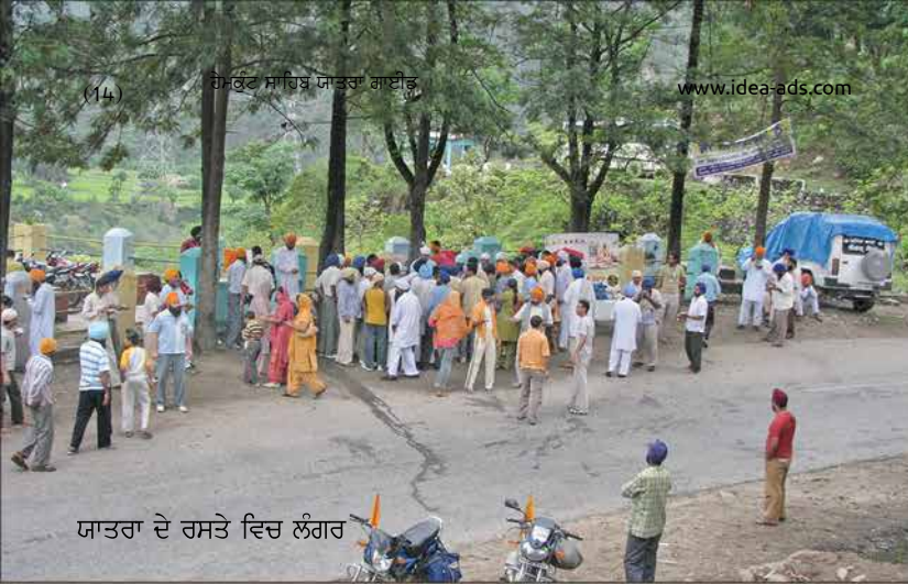
ਯਾਤਰਾ ਦੇ ਰਸਤੇ ਵਿਚ ਲੰਗਰ

ਨਹੀਂ ਚਲ ਸਕਦੀ। ਇਸ ਲਈ ਟ੍ਰੈਫਿਕ ਇਕ-ਪਾਸੜ ਕਰ ਦਿੱਤੀ ਜਾਂਦੀ ਹੈ ਤਾਂ ਕਿ ਕੋਈ ਦੁਰਘਟਨਾ ਨਾ ਵਾਪਰ ਸਕੇ। ਪਹਿਲਾਂ ਇਕ ਪਾਸੇ ਦਾ ਟ੍ਰੈਫਿਕ ਤੋਰਿਆ ਜਾਂਦਾ ਹੈ ਅਤੇ ਦੂਸਰੇ ਪਾਸਿਓਂ ਗੇਟ ਬੰਦ ਕਰ ਦਿੱਤਾ ਜਾਂਦਾ ਹੈ। ਇਸੇ ਤਰ੍ਹਾਂ ਦੂਜੇ ਪਾਸਿਓਂ।